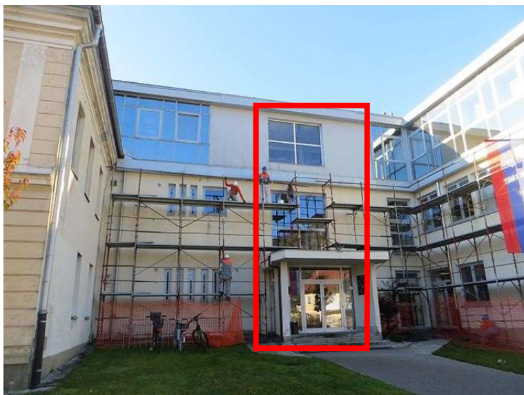
Pozicija prizidka z dvigalom