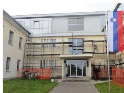
Pogled na glavni vhod