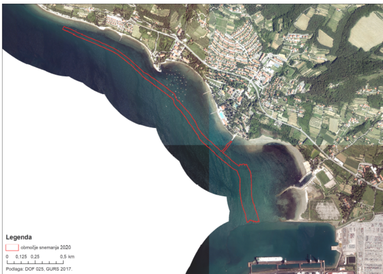
Slika 1: Območje morskih travnikov – 3. pomol Luke Koper v smeri Ankaran