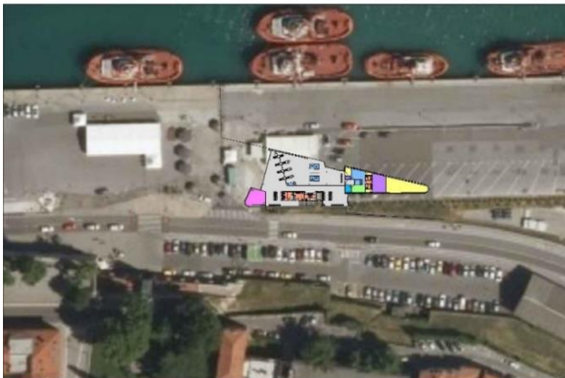
Slika 2: Ortografski posnetek umestitve novega terminala