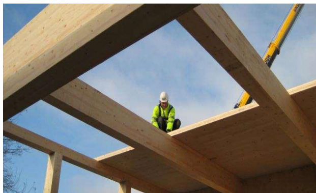
Slika 4: Uporaba trajnostnih materialov

Zasnova objekta predvideva izolacijski ovoj, ki zagotavlja minimalne izgube. Prav tako je s postavitvijo steklenih površin preprečeno direktno pregrevanje s strani sonca, kar je na slovenski obali večji problem kot same toplotne izgube v zimskem času. Objekt se ogreva in hladi preko centralnega sistema, ki ga napaja toplotna črpalka, ki je nameščen v servisnem prostoru na vzhodnem delu objekta. Za objekt je predviden centralni sistem rekuperacije preko kanalov v stropu objekta. Vse zunanje enote se nahajajo na severni steni objekta in so usmerjene stran od historignega mestnega jedra.