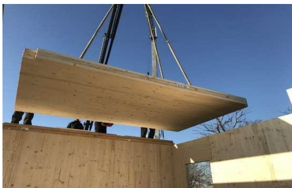
Slika 3: Prefabricirana montažna gradnja

Objekt je postavljen na območje nekdanjega skladišča blagovnih rezerv z namenom, da za svoje potrebe izkoristi obstoječe temeljenje. Zasnovan je kot prefabricirana montažna zgradba, ki jo je možno hitro izvesti in posledično tudi hitro demontirati in reciklirati v duhu trajnostne uporabe materialov. Osnovna konstruktivna materiala terminala sta jeklo in les, ki delujeta sovprežno. Osnovni volumen terminala je izdelan iz križno lepljenih masivnih lesenih plošč (KLH). Masivne plošče so medsebojno povezane in ustrezno zavetrovane. Stebri in podporna konstrukcija steklenih površin sta jekleni in sovprežno vezani na leseno strukturo. Konstrukcija zasnova tako izhaja kot parafraza lesenih bark, ki so se na tem območju gradile v drugi polovici devetnajstega stoletja in objektu terminala daje tudi prepoznavno obliko.