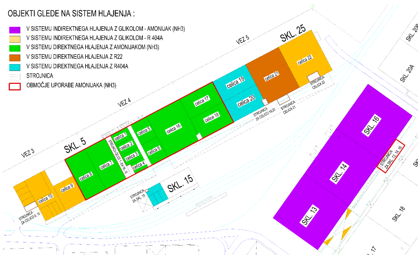
Slika 3 – označba celic glede na sistem hlajenja