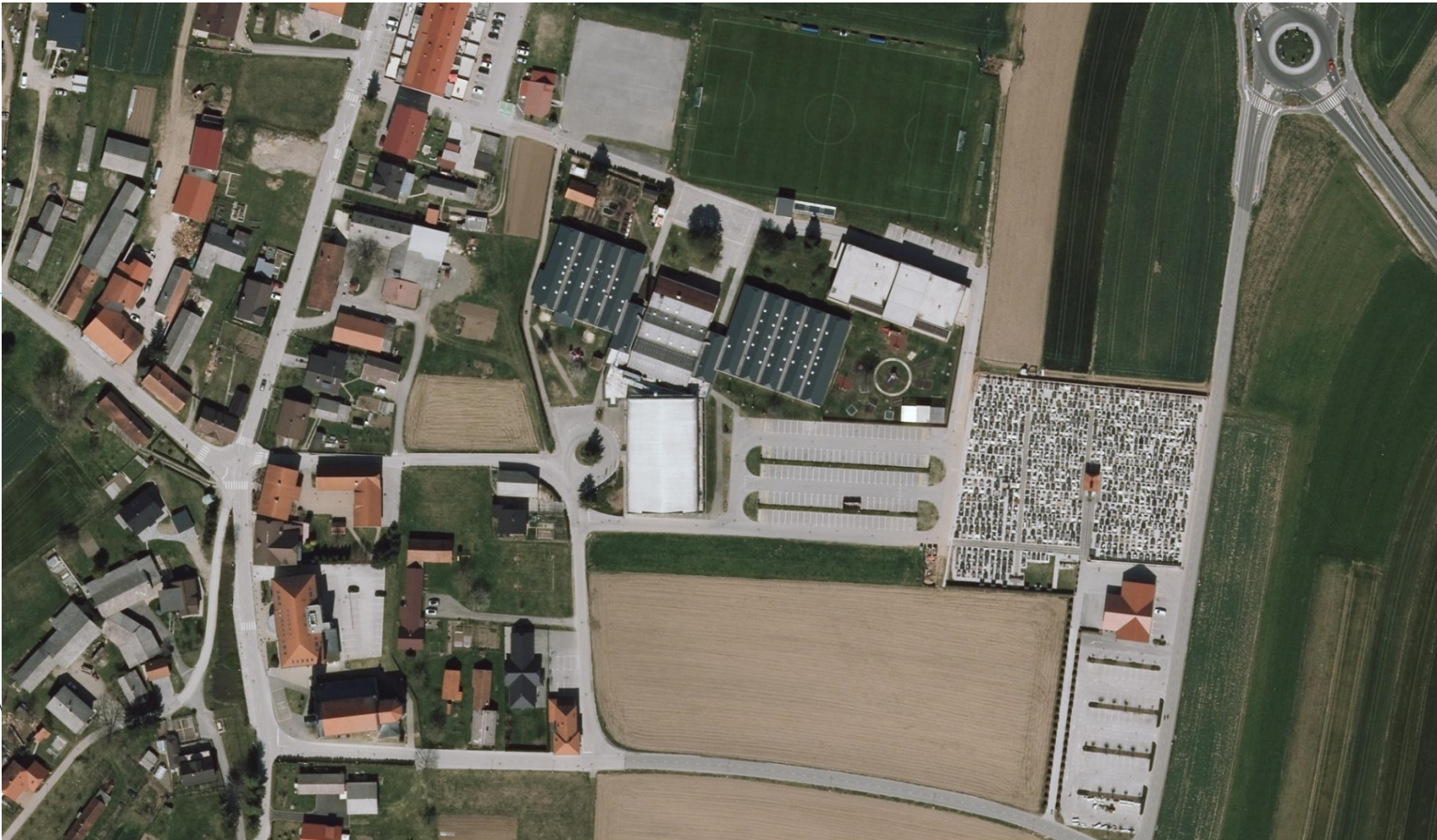
POGLED NA OS 5-4

PREZRAČEVANJE - OBSTOJEČE STANJE TLORIS PRITILUČJA