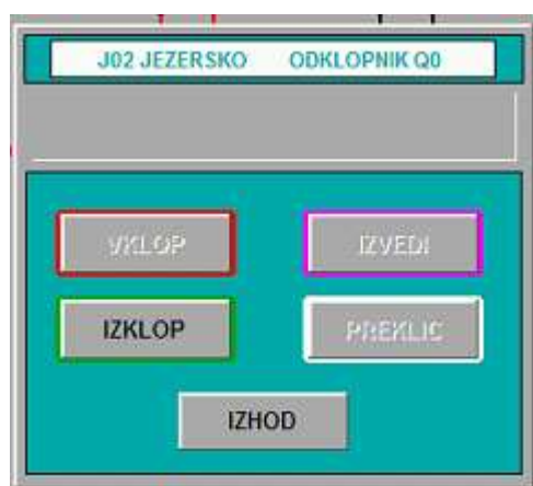
Slika 5: Princip organizacije okna za izvajanje stikalnih manipulacij