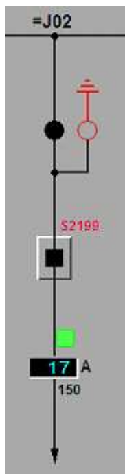
Slika 1: Primer simbolov v vodni celici

Primer simbolov v vodni celici je prikazan na sliki 1: