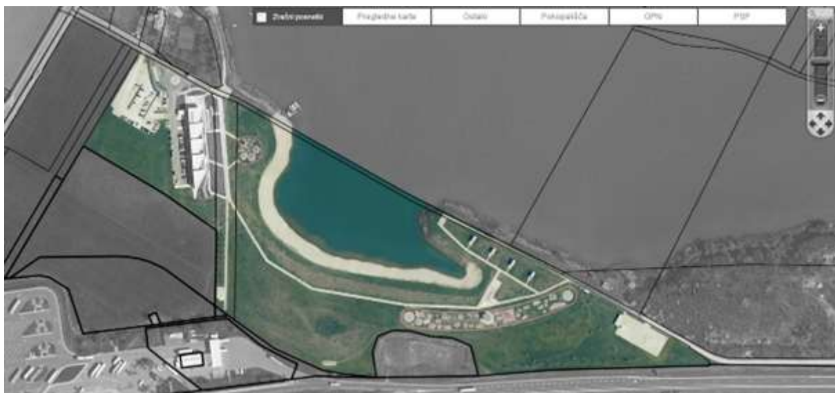
Karta 1: Zemljišča, na katerih se bodo izvajale naročene storitve

Nasprotno, druga zemljišča, ki niso predvidena za mulčenje in košnjo trave, so na karti prikazana v črno-beli barvi oz. sivih tonih.