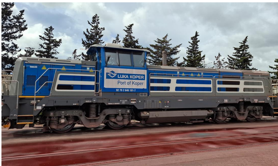
Slika 1: Dizel lokomotiva int. oznake LK04