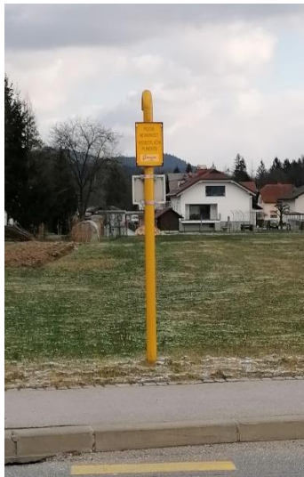
Primer izvedene vohalne cevi