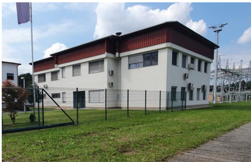
Slika 1: Stara komandna zgradba RTP Maribor

Tlorisni gabarit obstoječe (stare) komandne zgradbe, je 27,9 m x 19,6 m. Višina slemena štirikapne strešine je 10,5 m nad koto pritličja. Objekt je zasnovan iz sistema armiranobetonskih sten, ki so v nivoju 1. etaže povezani z armirano betonsko ploščo. Plošča proti ostrešju je armiranobetonska in rebričasta z opečnimi polnili. Streha na objektu je štirikapnica z naklonom 6°. Ostrešje je leseno, strešna kritina je trapezna – pločevinasta. Fasada objekta je sestavljena iz obstoječe konstrukcije debeline 32,5 cm na katero je bilo, ob prenovi leta 2001, dodanih 12 cm toplotne izolacije z ometom kot finalnim zaključnim slojem. V predelu ostrešja (prvotno betonska atika) je fasada zaključena s trapezno pločevino na 5 cm toplotne izolacije.