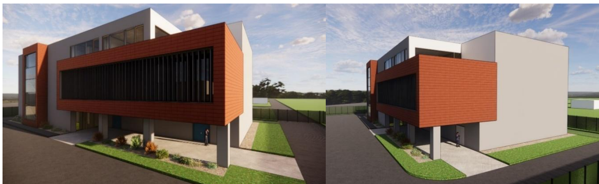
Slika 4: OOS – Fotorealistični prikaz zunanosti stavbe

Kvadrast volumen ima v različnih etažah odvojen ali pripojen volumen manjšega obsega. V pritličju je z odvzemanjem prostora med osmi D-G in 1-2 predviden arkadni prehod, ki vodi do glavnega vhoda. V prvem nadstropju je predviden gank, ki je namenjen vzdrževanju steklenih površin ter nosilec za senčila, sestavljena iz vertikalnih lamel. Gank skupaj s prostori ob njem generira dodan volumen, ki je še dodatno poudarjen s členjenostjo fasade. V tej etaži je predvidena tudi zunanja poglabitev, ki sega čez obe etaži in je namenjena svetlobnemu jašku.