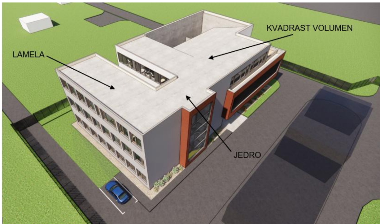
Slika 3: OOS – Fotorealistični prikaz z oznakami posameznih volumnov