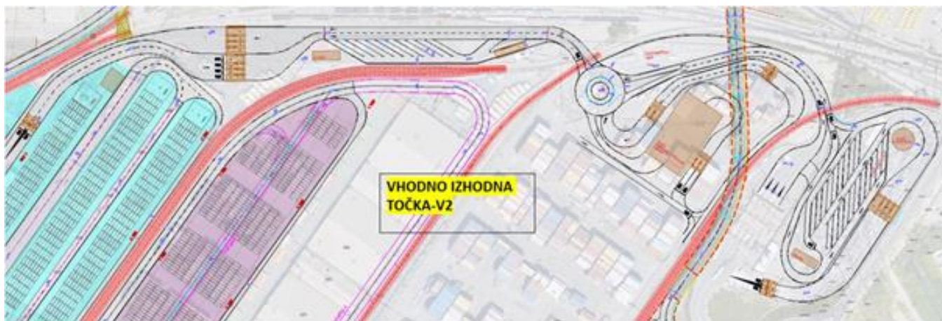
Slika: Informativna skica vhodno-izhodne točke (Slika ni v celoti skladna z zahtevami iz specifikacije naročila, gre samo za idejo - informativno skico).

Predmet naročila je postavitve testnega OCR portala na obstoječo vhodno točko Luke Koper ter postavitve nove vhodno-izhodne točke za tovornjake s sistemom za prepoznavanje tovornjakov in kontejnerjev (OCR) v dveh fazah (prva faza: Postavitve testnega OCR portala in druga faza: Postavitve ostale opreme vhodno-izhodne točke). Naročilo zajema tudi deset (10) letno vzdrževanje postavljene opreme.