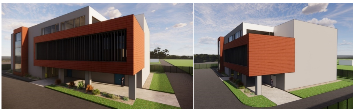
Slika 4: OOS – Fotorealistični prikaz zunanosti stavbe

Kvadrast volumen ima v različnih etažah odvzet ali pripojen volumen manjšega obsega. V pritličju je z odvzemanjem prostora med osmi D-G in 1-2 predviden arkadni prehod, ki vodi do glavnega vhoda. V prvem nadstropju je predviden gank, ki je namenjen vzdrževanju steklenih površin ter nosilec za senčila, sestavljena iz vertikalnih lamel. Gank skupaj s prostori ob njem generira dodan volumen, ki je še dodatno poudarjen s členjenostjo fasade. V tej etaži je predvidena tudi zunanja poglobitev, ki sega čez obe etaži in je namenjena svetlobnemu jašku.