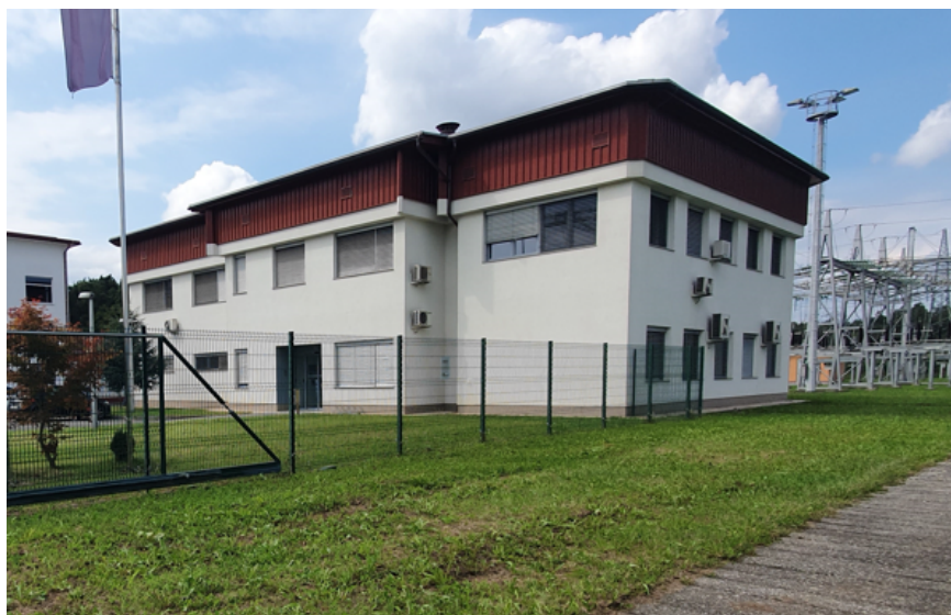
Slika 1: Stara komandna zgradba RTP Maribor

Tlorisni gabarit obstoječe (stare) komandne zgradbe, je 27,9 m x 19,6 m. Višina slemena štirikapne strešine je 10,5 m nad koto pritličja. Objekt je zasnovan iz sistema armiranobetonskih sten, ki so v nivoju 1. etaže povezani z armirano betonsko ploščo. Plošča proti ostrešju je armiranobetonska in rebričasta z opečnimi polnili. Streha na objektu je štirikapnica z naklonom 6°. Ostrešje je leseno, strešna kritina je trapezna – pločevinasta. Fasada objekta je sestavljena iz obstoječe konstrukcije debeline 32,5 cm na katero je bilo, ob prenovi leta 2001, dodanih 12 cm toplotne izolacije z ometom kot finalnim zaključnim slojem. V predelu ostrešja (prvotno betonska atika) je fasada zaključena s trapezno pločevino na 5 cm toplotne izolacije.