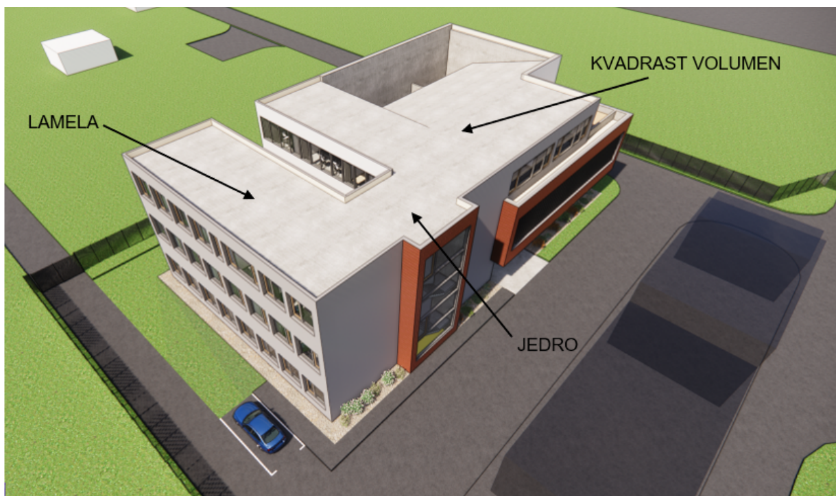
Slika 3: OOS – Fotorealistični prikaz z oznakami posameznih volumnov