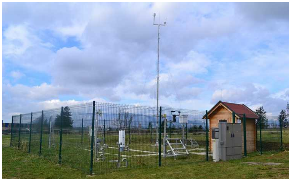
Slika 1: Meteorološko merilno mesto Postojna