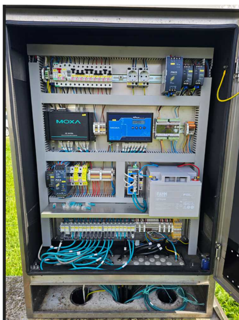
Slika 3: Avtomatska meteorološka merilna postaja