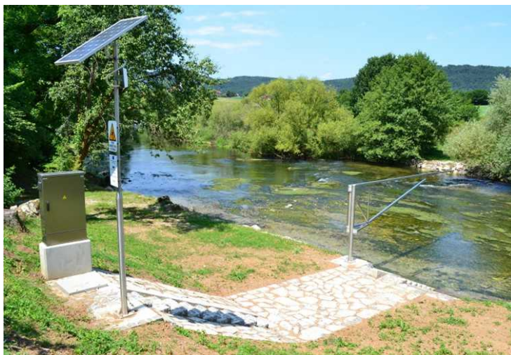
Slika 4: Merilno mesto površinskih voda