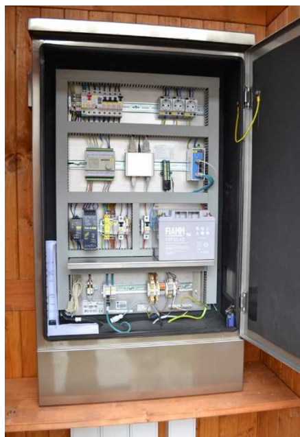
Slika 5: Avtomatska merilna postaja za površinske vode s priklopom na javno elektro omrežje, tip komunikacije ADSL/MPLS