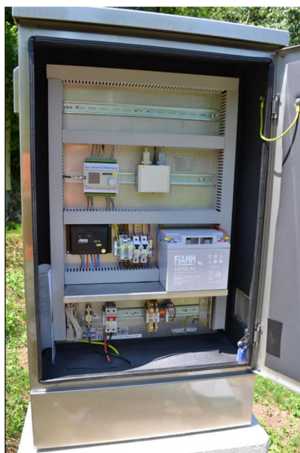
Slika 6: Avtomatska merilna postaja za površinske vode s priklopom na solarno napajanje, tip komunikacije GSM/GPRS