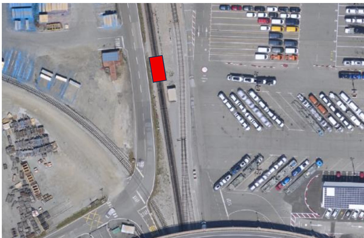
Slika 1: Lokacija prestavitve dinamične tirne tehtnice

Dinamično tirno tehtnico se prestavi na tiru št. 43, ki je sestavni del IV. skupine tirov v Koprskem tovornem pristanišču. Tehtnica bo locirana na parceli št. 878/8 k.o. Ankaran, spodaj prikazano v rdeči barvi.