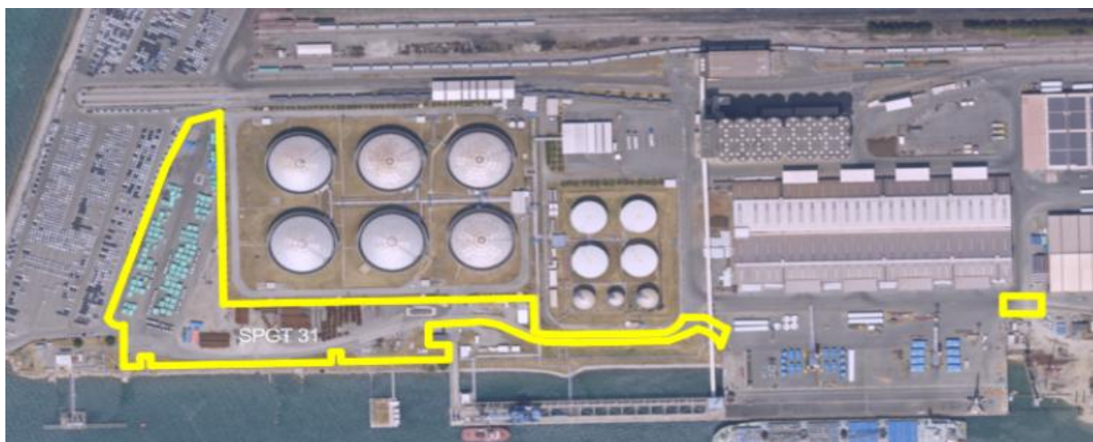
Slika 1: Lokacijski prikaz površin na pomolu II, ki se jih bo preuredilo za skladiščenje projektnih tovorov

1. del naročila (vezano na naložbo Ureditve površine za skladiščenje projektnih tovorov za potrebe PC GT) (v nadaljevanju: 1. del naročila): Izdelava geotehničnih raziskav za skladiščenje projektnih tovorov za potrebe GT.