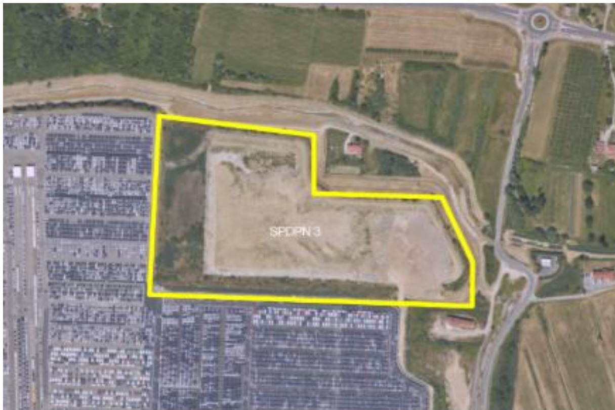
Slika 3: Lokacijski prikaz območja kasete 7A

Za namen izvedbe geotehničnih raziskav je izdelana naslednja dokumentacija: