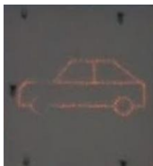
Slika 2: Primer prikaza na ZGORNJI el. tabli: simbol »avtomobil/tovornjak«. Prikaz za »avtomobil«

V primeru postavitve ene table nad drugo (Slika 1) se nad vsak prometni pas na nadstrešnici postavi dve tabli. ZGORNJA tabla prikazuje vrsto vozila »avtomobil/tovornjak« ali pa je simbol ugasnjen (brez vsakršnega prikaza), SPODNJA tabla prikazuje prevoznost prometnega pasu » odprt prehod « (usmerjena zelena puščica navpično navzdol, razen pri enem vhodnem pasu, kjer je usmerjena zelena puščica desno navzdol (lokacija table je prikazana na Sliki 4), ali » zaprt prehod « (rdeč »X«), ali pa je simbol ugasnjen (brez vsakršnega prikaza) Slika 3).