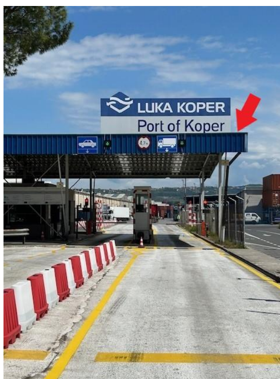
Slika 4: Vhodni pasovi: Zamenjava obstoječe signalizacije z novimi LED tablam. Na desni rob nadstrešnice (rdeča puščica) se postavi dodatni tabli, ena pod drugo (zgornja s prikazom simbola »avtomobil/tovornjak« spodnja s prikazom »desno navzdol« / »X«)