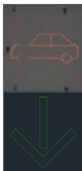
Slika 1: primer postavitve ena table nad drugo (ZGORNJA tabla prikaz vrste vozila »avtomobil«, SPODNJA tabla zelena »puščica« usmerjena navpično-navzdol

V nadaljevanju prikaz simbolov na elektronskih tablah in primer postavitve (ZGORNJA/SPODNJA tabla)