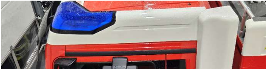
Slika 12: Primer belega okrova na strehi