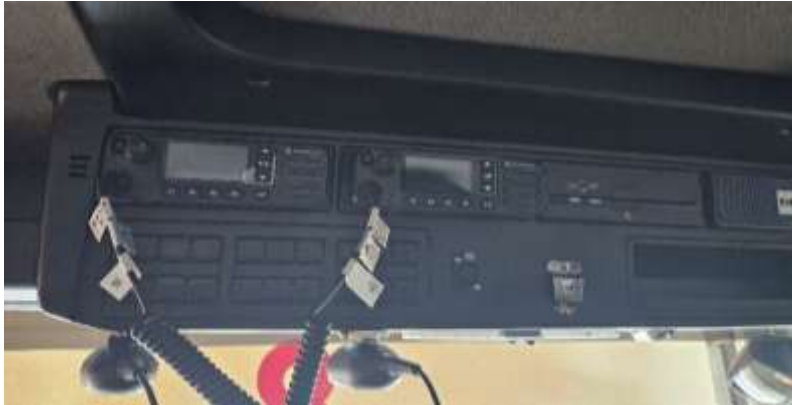
Slika 2: lokacija vgradnje radijskih postaj

Vozilo ima v kabini zgoraj vgrajeni dve mobilni UKW postaji. Obe sta sprogramirani na nacionalni sistem ZARE – shema GARS Kranj. Ena postaja je tipa DM 4601e in ena postaja tipa DM 4600e ali enakovredni z anteno in napeljavo (točno lokacijo vgradnje postaje določi naročnik). Postaji se morata avtomatsko vklopiti ob zagonu vozila in izklopiti ob ugasnitvi vozila. Anteni radijskih postaj naj bosta tipa Procom ML1-ZR/160/bbmu/ ali enakovredni. Radijsko postajo DM 4600e dostavi naročnik, postajo DM 4601e pa dobavi dobavitelj vozila.