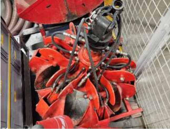
Slika 10: Obstoječi večkraški grabež