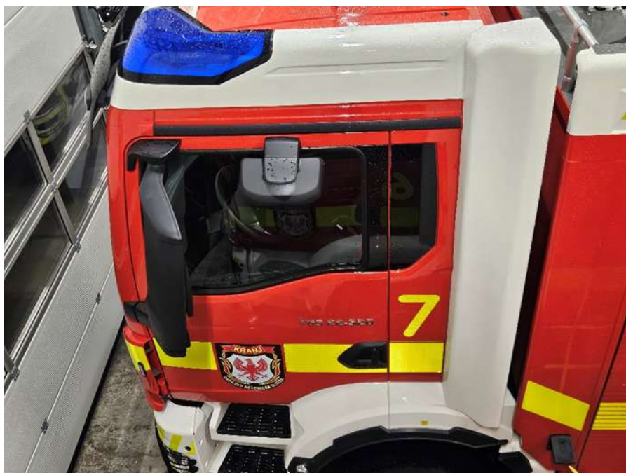
Slika 7: primer okrova na strehi in blende ob straneh

Streha kabine mora imeti nameščen okrov iz umetne mase z integriranimi modrimi LED lučmi ter belo blendo na bokih vozila.