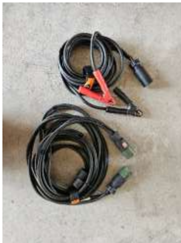
Slika 4: kabla za NATO priklop