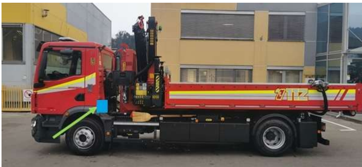
Slika 21: lokacija reflektorjev pod kabino za osvetlitev boka vozila

Vklop osvetlitve okolice mora biti avtomatsko pri vzratni vožnji, prav tako mora omogočati ročni vklop iz kabine tudi ob sproščeni ročni zavori (vožnja po ozkih delih). Vklop osvetlitve okolice se prilagodi zahtevam homologacije.