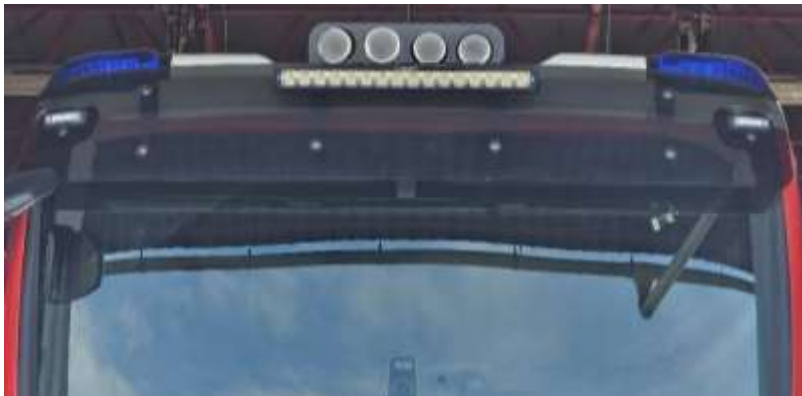
Slika 22: namestitev delovne LED luči spredaj

Bleiweisova cesta 34 4000 Kranj Splet: http://www.gasilcikranj.si Email: direktor@gasilcikranj.si