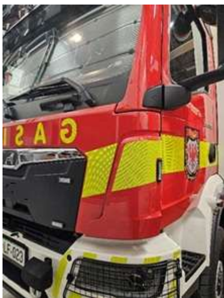
Slika 26: ujemanje sprednje in bočne črte

Bleiweisova cesta 34 4000 Kranj Splet: http://www.gasilcikranj.si Email: direktor@gasilcikranj.si