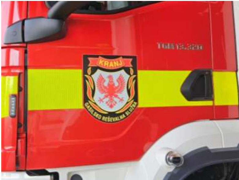
Slika 24: lokacija grba enote

Na voznikovich in sovoznikovih vratih mora biti nalepljen grb enote GARS Kranj. Grb mora biti odseven in laminiran, zaradi boljše obstojnosti. Širina grba na zgornjem robu je 32 cm.