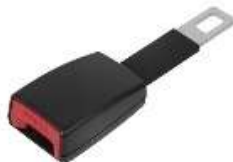
Slika 1: primer podaljška varnostnega pasu