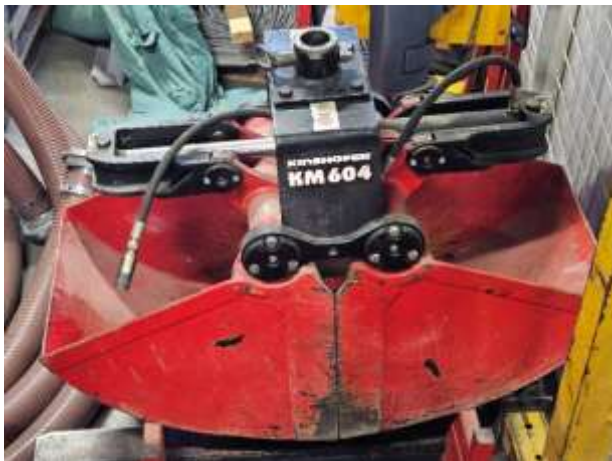
Slika 9: Obstoječa školjkasta žlica