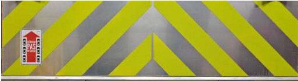
Slika 28: črte na zadnji stranici

Bleiweisova cesta 34 4000 Kranj Splet: http://www.gasilcikranj.si Email: direktor@gasilcikranj.si