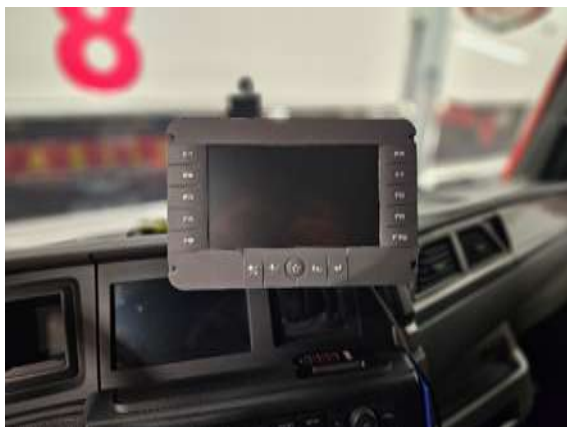
Slika 6: lokacija in primer nadzorno upravljalne konzole

Bleiweisova cesta 34 4000 Kranj Splet: http://www.gasilcikranj.si Email: direktor@gasilcikranj.si