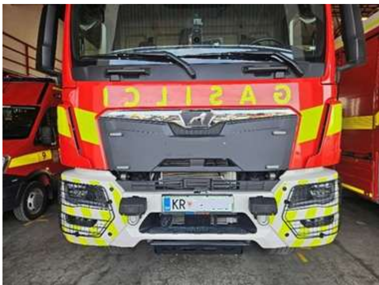
Slika 27: poševne črte in napis GASILCI

Sprednja stran vozila naj bo grafično opremljena s poševnimi črtami v obliki črke V po celotnem sprednjem odbijaču vozila. Debelina črt je 5,5 cm. (slika 27 - črte v obliki smreke)