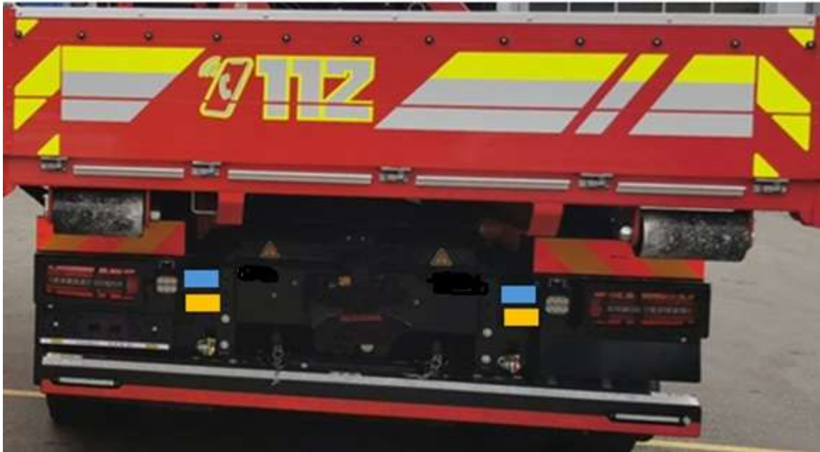
Slika 17: lokacija vgradnje LED bliskavic na zadnjem delu vozila

Bleiweisova cesta 34 4000 Kranj Splet: http://www.gasilcikranj.si Email: direktor@gasilcikranj.si