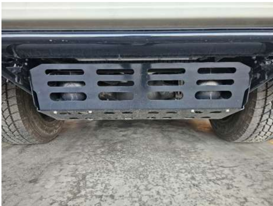
Slika 18: lokacija namestitve zvočnika elektronske sirene

Bleiweisova cesta 34 4000 Kranj Splet: http://www.gasilcikranj.si Email: direktor@gasilcikranj.si