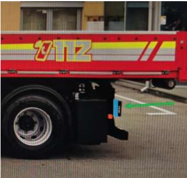
Slika 16: lokacija vgradnje LED bliskavic na zadnji bočni del vozila