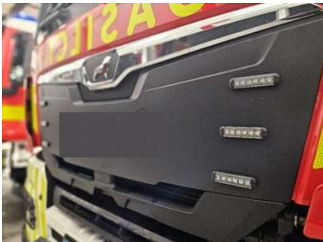
Slika 14: Lokacija vgradnje LED bliskavic v maski vozila