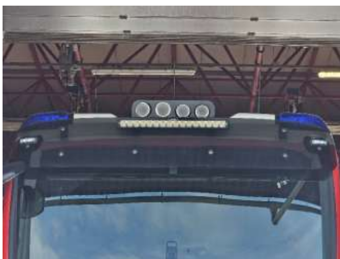
Slika 19: namestitev zračne sirene

Poleg elektronske sirene mora imeti vozilo tudi zračno sireno proizvajalca Martin Horn model 2298 GM ali enakovredni, montirano na strehi vozila med obe modri integrirani bliskavici in nad reflektor za osvetlitev okolice. Zračna sirena mora delovati na način, da v enem intervalu, ki traja 3 sekunde odda 4 tone. Moč zračne sirene naj bo 125 db (A) na oddaljenosti 1 metra. Sirena ne sme delovati brez delovanja modrih bliskavic. Ob delovanju modrih bliskavic, mora zračna sirena ob pritisku tipke hupe vozila na volanskem obroču, izvesti 1 interval delovanja. Troblje zračne sirene morajo biti po zgornji strani zaščitene z mrežasto ali podobno zaščito. Kompresor zračne/pnevmatske sirene je nameščen predvidoma pod sredinski sedež oziroma za sopotnikov sedež. Zaščiten mora biti pred udarci in ostalimi dejavniki (voda, prah).