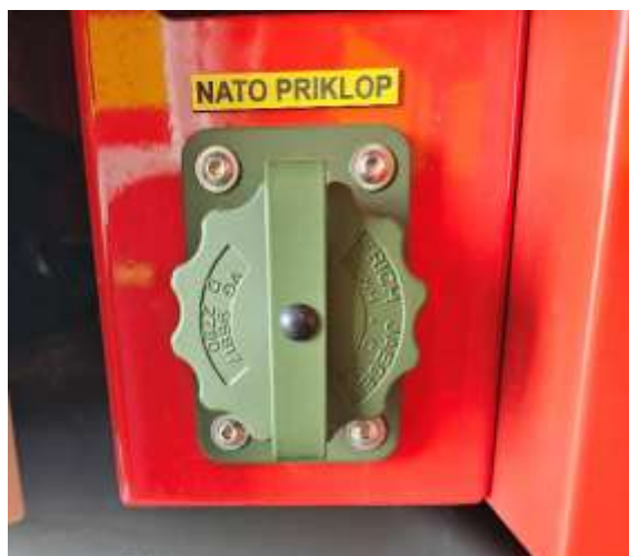
Slika 5: NATO priklop na vozilu