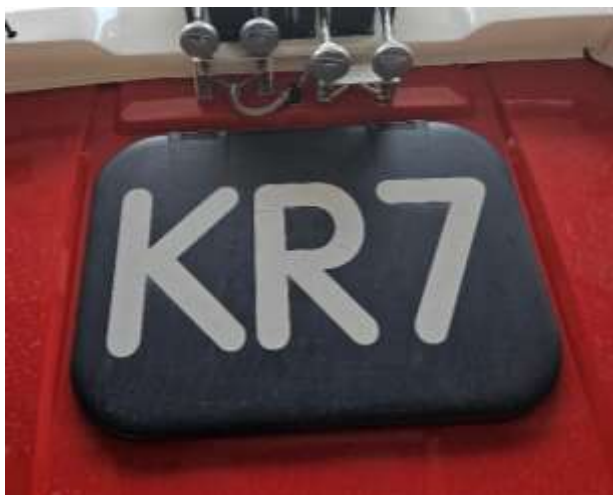
Slika 30: primer oznake vozila na mehanski strehi kabine.

Bleiweisova cesta 34 4000 Kranj Splet: http://www.gasilcikranj.si Email: direktor@gasilcikranj.si