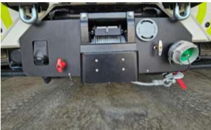
Slika 11: Primer vgradnje vitla ter odklopnega stikala

Montiran naj bo v sprednjem delu vozila, predvidoma v sprednjem odbijaču. Izstopno mesto jeklenice je spredaj z ustreznim vodilom – valji za zaščito vrvi iz leve, desne, spodnje in zgornje strani. Zaključek jeklenice je z jekleno srčiko. Krmiljenje je z upravljalno konzolo preko kabla dolžine min. 1m (lokacija priklopa konzole v dogovoru z naročnikom – predvidoma poleg vitla). Prav tako mora biti zraven vitla nameščeno odklopno stikalo, ki prekine napetost oziroma napajanje vlečne naprave.