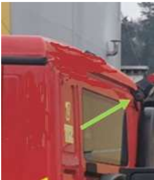
Slika 23: namestitev delovne LED luči zadaj

Na zadnji rob strehe, na desno stran, se v smeri nazaj namesti ena delovna LED luč LAZER UTILITY-45 ali enakovredni.