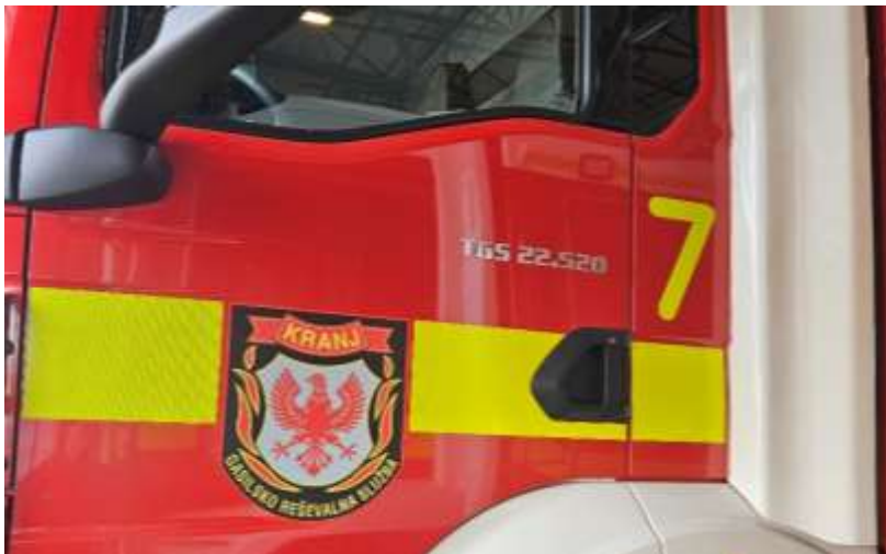
Slika 29: lokacija številke vozila

Na levi in desni strani, mora biti nalepljena številka vozila – 13. Lokacija številke je predvidoma med belo blendo in vrati kabine, nekje na višini stekla vrat kabine (slika 29). Številka je iz ORALITE VC612 Flexibright ali enakovredne folije, pisava VAGRAUNDED odebeljeno. Točno velikost in lokacijo določi naročnik pred izdelavo. Predvideno pa je maksimalne širine, kot je široka omenjena lokacija