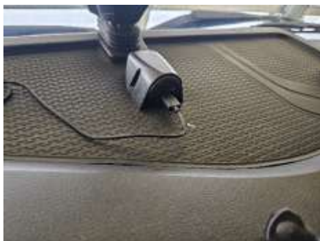
Slika 1: lokacija USB vtičnice