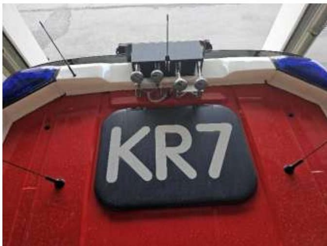
Slika 20: primer zaščite zračne sirene

Bleiweisova cesta 34 4000 Kranj Splet: http://www.gasilcikranj.si Email: direktor@gasilcikranj.si