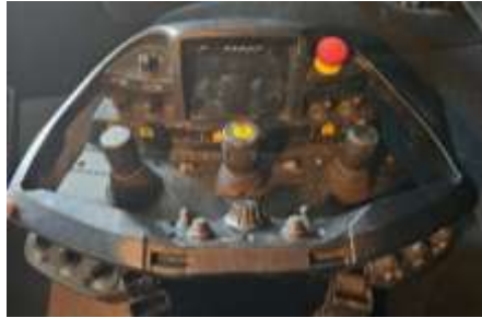
Slika 8: primer daljinskega upravljalnika