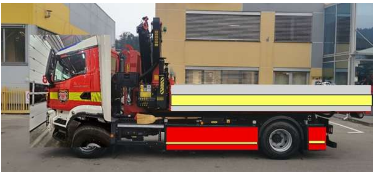
Slika 25: bočna polepitev

Stranice vozila na bodo grafično obdelane z eno črto po celotnem boku vozila (slika 25), ter gaberitnimi črtami. Bočna črta sledi liniji, ki pride iz sprednje strani (iz maske vozila – slika 26), debelina te bočne črte je 20 cm. Nalepljena je preko celotnega boka vozila, razen na beli blendi med kabino in nadgradnjo vozila. Gaberitna črta je debeline 5,5 cm. Nalepljena je po spodnjem robu boksov pod kesonom. Črta je tudi na zadnjem braniku vozila. Tudi te črte so iz folije, ki je navedena v uvodu.