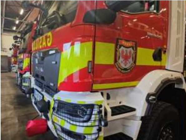
Slika 15: Lokacija vgradnje LED bliskavic v bokih kabine